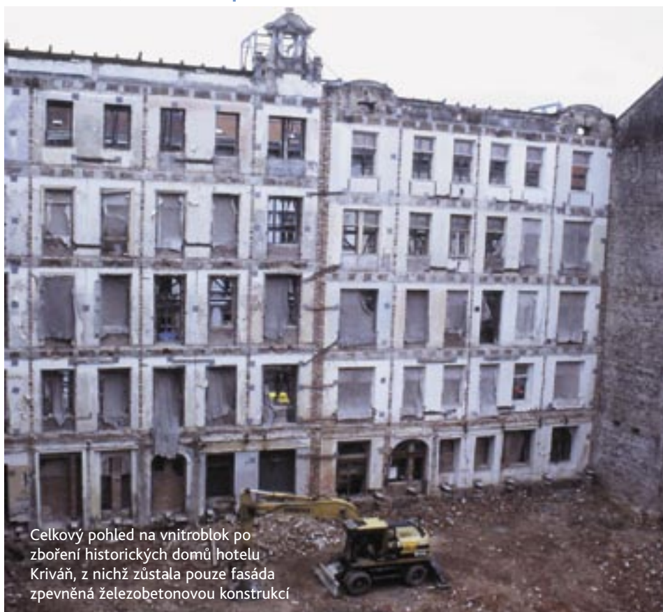
Celkový pohled na vnitroblok po zboření historických domů hotelu Kriváň, z nichž zůstala pouze fasáda zpevněná železobetonovou konstrukcí

PŘIPRAVIL: VOJTĚCH KAŠPAR