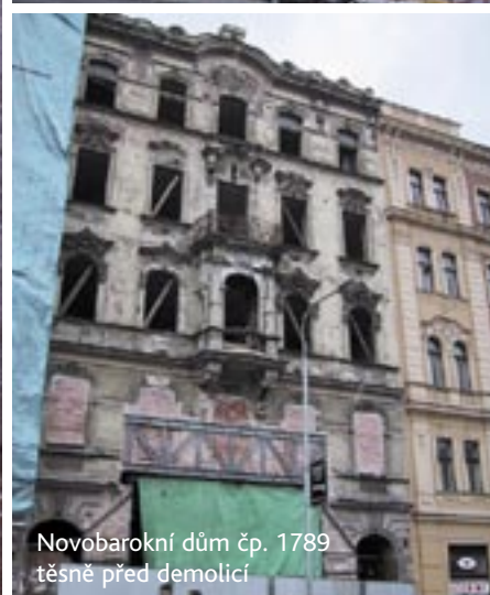
Novobarokní dům čp. 1789 těsně před demolicí

Jedním ze základních požadavků současné památkové péče je vedle ochrany památkově hodnotných objektů také snaha o udržení původní funkce konkrétního objektu. Sledujme pohnuté osudy hotelu Kriváň, jenž prošel za sto let své existence všemi možnostmi funkčně provozního využití.