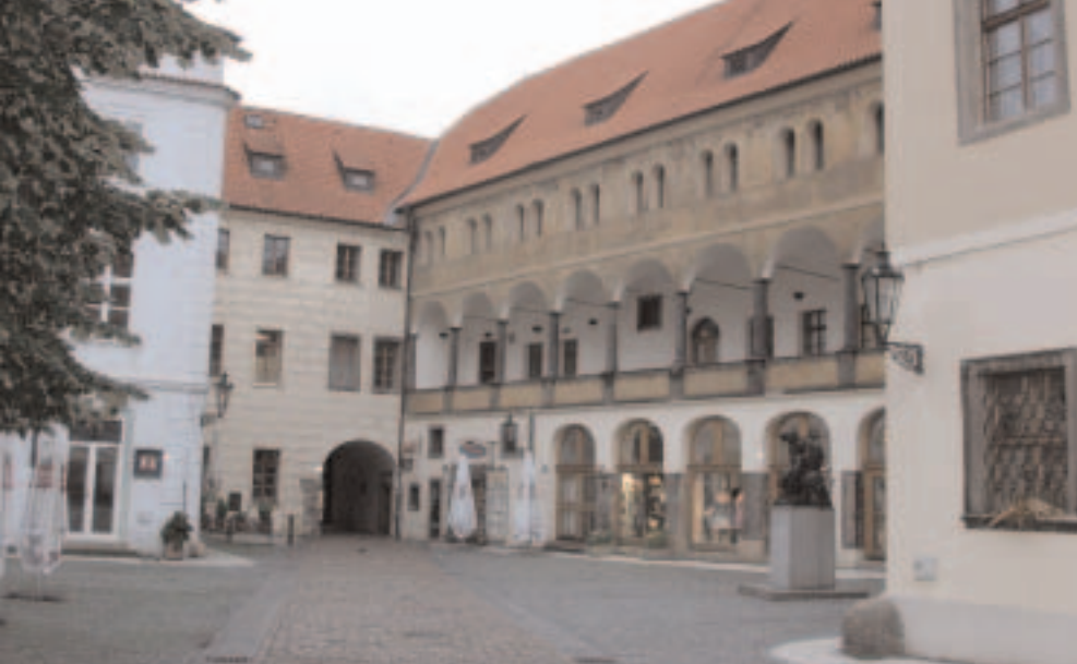
Západní věžový vstup do areálu opevněného Týna – Ungeltu od východu z prostranství dvora

centrální pražské tržiště. Dvůr patřil knížeti a měl vlastní zprávu, včetně knížecího soudce, který řešil pře a trestal zločiny. První písemné zmínky o dvoru cizích kupců pocházejí z listinných falz Bořivoje II. (1100–1107). Pragmatickým účelem dvora bylo vyložení nákladu, prodej zboží a odvedení daně (cla zvaného ungelt). Ungelt byl poplatek obsahující tranzitní, dovozní i vývozní clo a sazbu za uskladnění zboží. Objekt byl po dlouhá léta rekonstruován systematicky archeologicky zkoumán a podařilo se rozlišit jeho složitý stavebně historický vývoj. Nejstarší fázi představuje západní část dnešní dispozice, opevněná příkopem, dřevěným ohrazením a dřevěnými objekty situovanými podél obvodu. Před polovinou 13. století dochází k rozšíření areálu na východ a zbudování románského opevnění z pravidelných opukových kvádrů. V areálu vznikají minimálně dva výstavní kamenné románské domy. Tento čistě obchodní komplex představuje krystalizační jádro pražské raně středověké sídelní aglomerace.