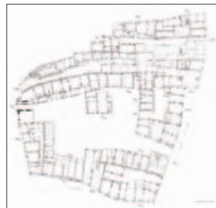
Půdorys Týna – Ungeltu

Nástup osvícenství v českých zemích byl doprovázen zájmem o vědu a technický pokrok. Ruku v ruce s tímto zájmem bylo