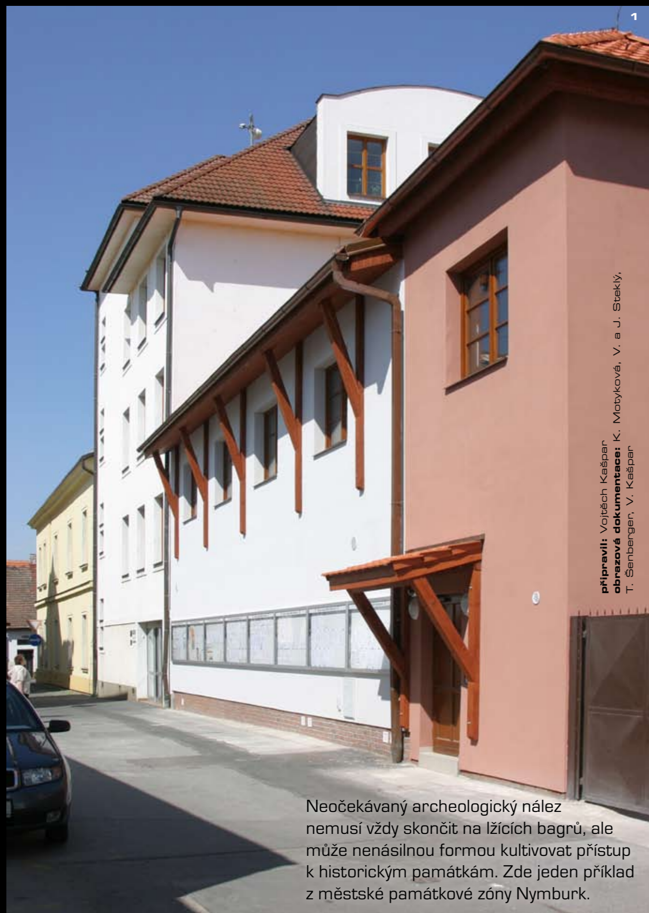
1 připravili: Vojtěch Kašpar

Neočekávaný archeologický nález nemusí vždy skončit na lžících bagrů, ale může nenásilnou formou kultivovat přístup k historickým památkám. Zde jeden příklad z městské památkové zóny Nymburk.